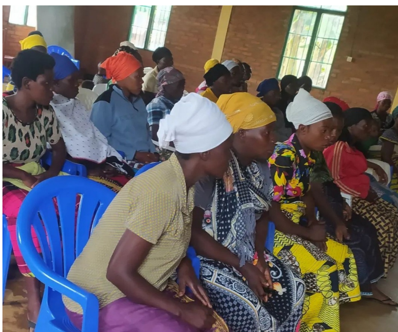
Zwangerschapsvoorlichting in Rwanda

De in het vorige hoofdstuk genoemde projecten passen binnen de missie en visie van Sifra Foundation. Onze visie is dat alle zwangeren in Oost-Afrika goede zorg omtrent zwangerschap, geboorte en kraamperiode ontvangen en voldoende kennis hebben om zelf zorg toe te passen zodat moeder- en kindsterfte en ziekte verminderen. Onze missie is om hoogwaardige zorg te leveren aan zwangeren, barenden en bevallen vrouwen. Zwangeren voorlichting te geven dicht bij de plek waar zij wonen door lokale gezondheidsmedewerkers. Door kennis bij zwangeren te vergroten wil de stichting vrouwen empoweren. Daarnaast is de missie om lokale gezondheidsmedewerkers voor dit werk op te leiden.